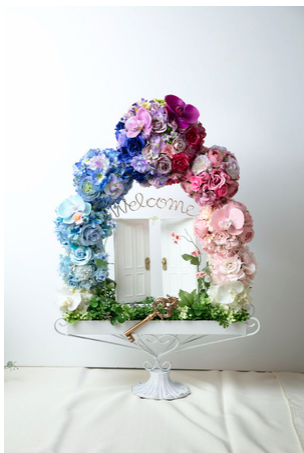
横浜ディスプレイミュージアム賞 吉 友里 曾我部翔賞